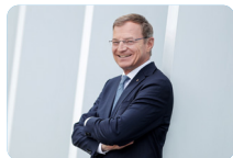
Mag. Thomas Stelzer Landeshauptmann

Diese „Spielregeln“ begleiten dich bis zu deinem 18. Geburtstag. Während dieser Zeit müssen auch deine Eltern sowie Lehrerinnen und Lehrer darauf achten, dass sie eingehalten werden.